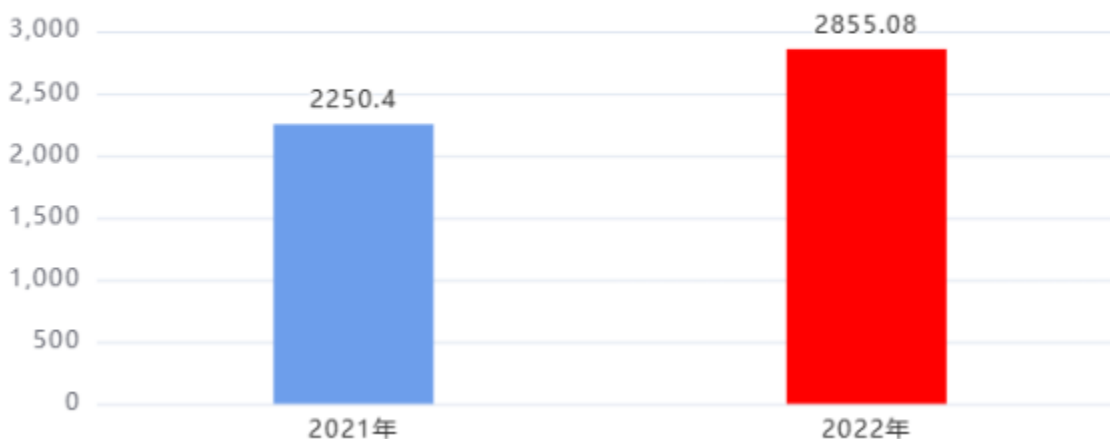
财政拨款支出对比图 (单位: 万元)

2022年度一般公共预算财政拨款支出年初预算2746.7万元，支出决算2,855.08万元，完成年初预算的103.95%，占本年支出合计的96.28%。与上年相比，财政拨款支出增加604.68万元，增长26.87%，增长的主要原因是：教师人数增加，人员经费增加。