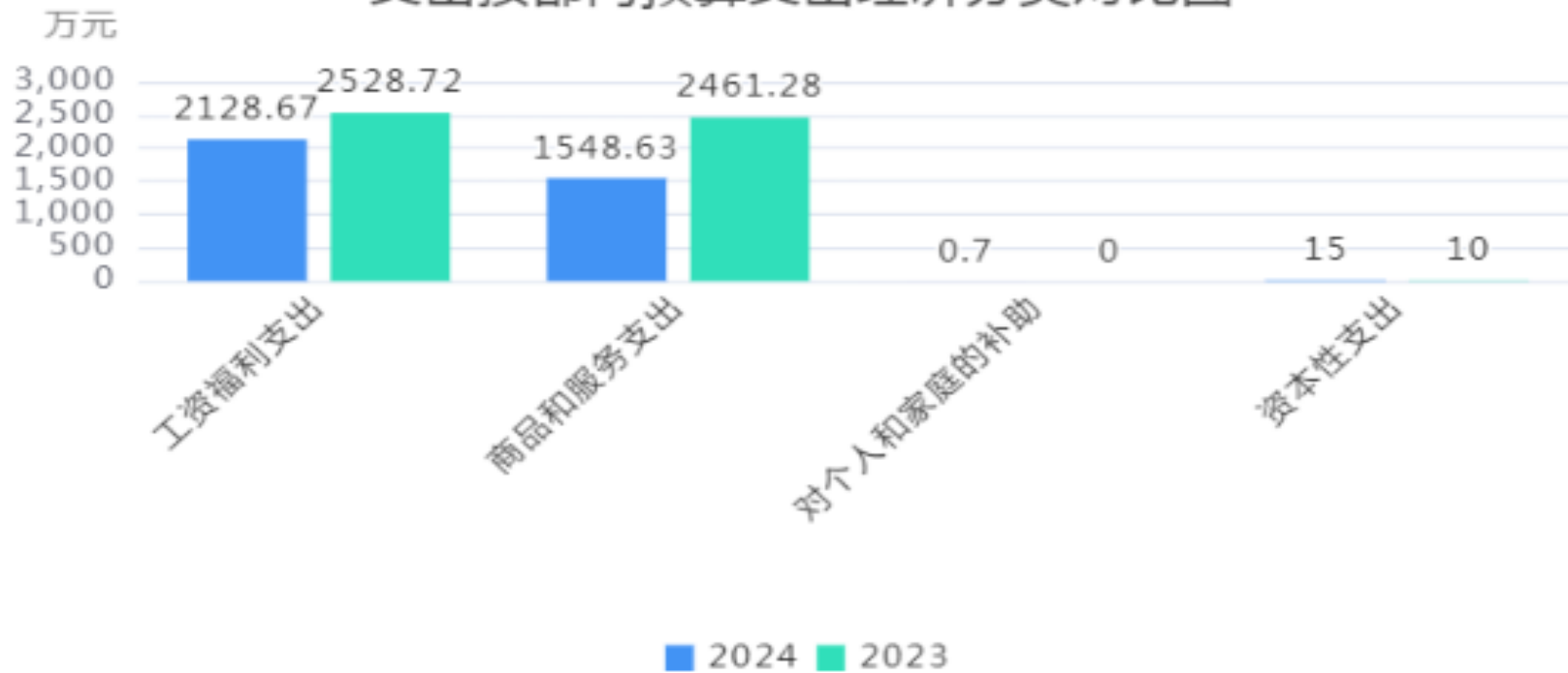
支出按部门预算支出经济分类对比图